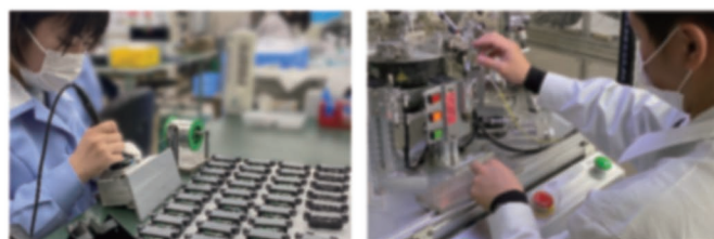
オゾン協会認定工場 JOA1020号